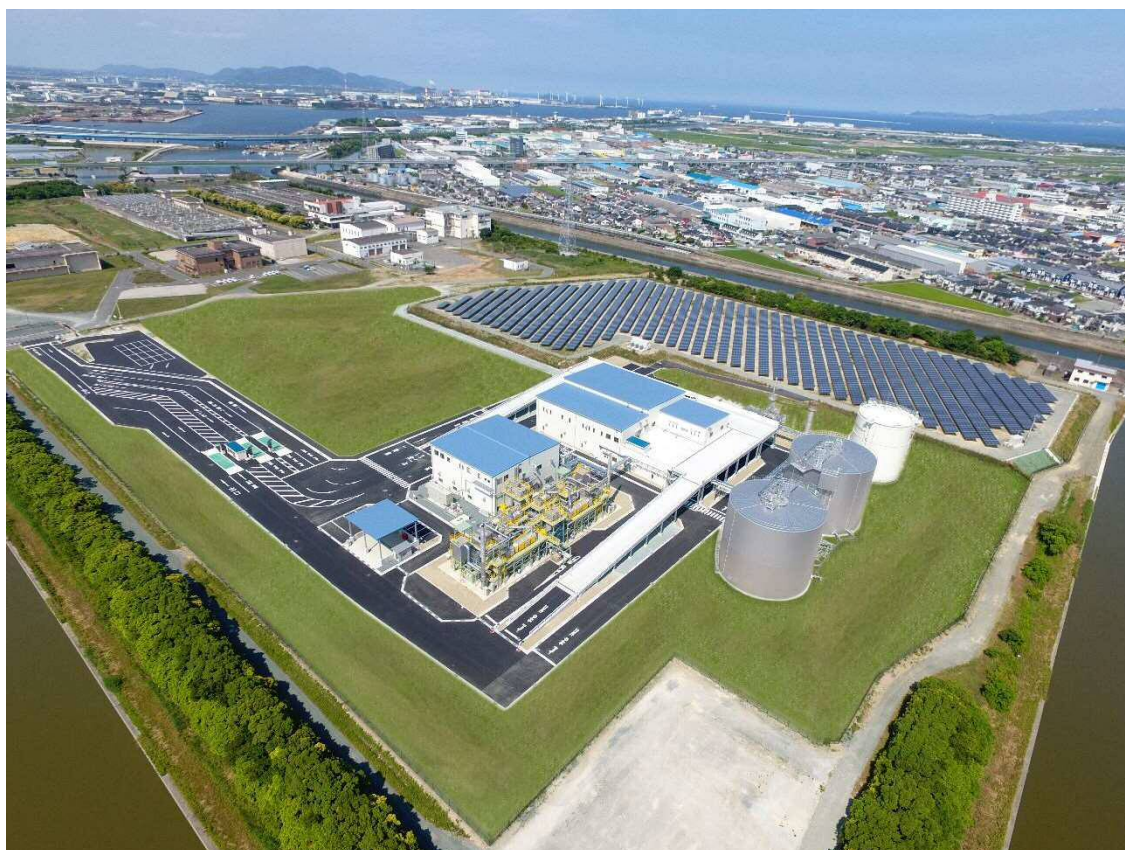
バイオマス利活用センター